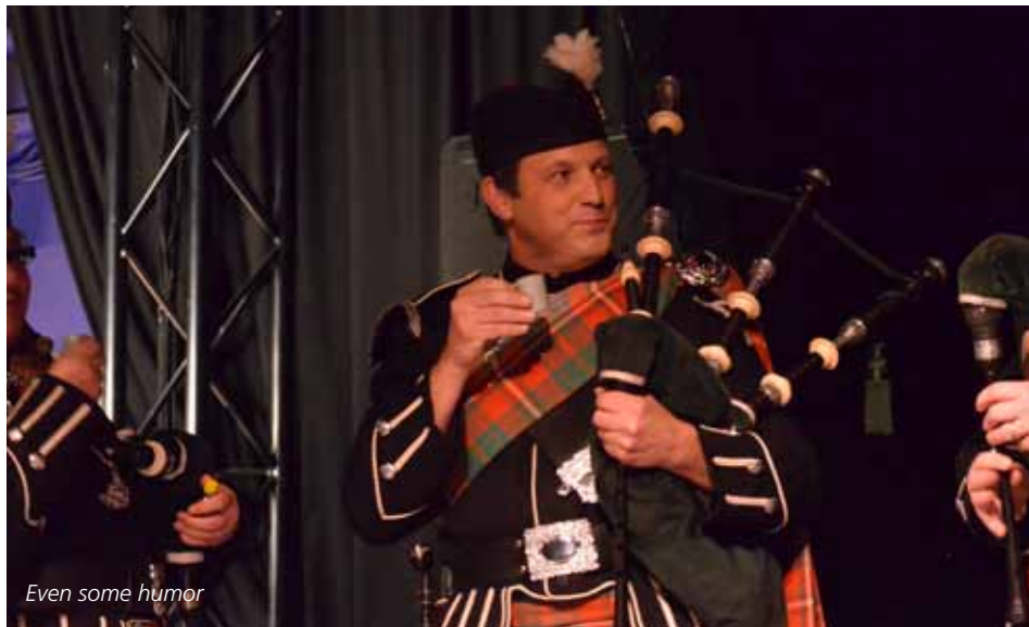
Even some humor

De nombreux membres du clan avaient suivi l'appel et participaient avec leur famille, pour rendre hommage à