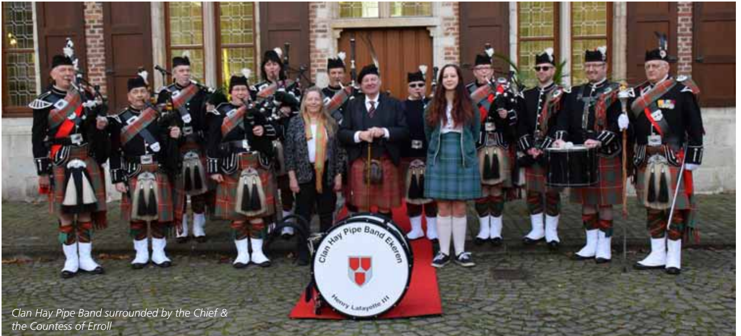
Clan Hay Pipe Band surrounded by the Chief & the Countess of Erroll

ces Pipers qui aident toujours à des moments joyeux ou tristes dans la vie de membres du clan . Que ce soit froid ou très chaud, ils ont toujours été présent afin de supporter l'événement familial.