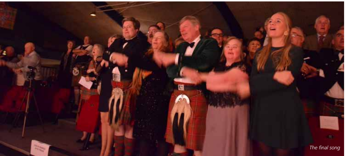
The final song