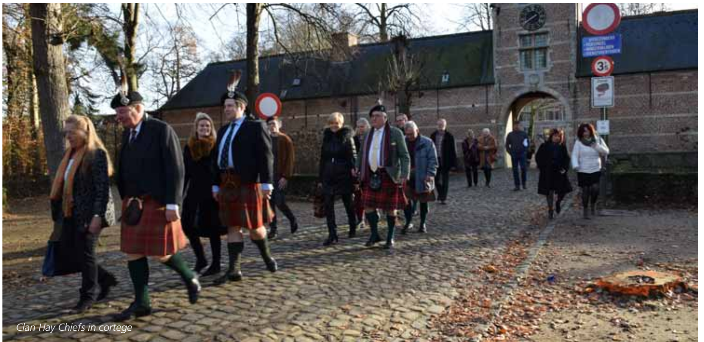
Clan Hay Chiefs in cortege