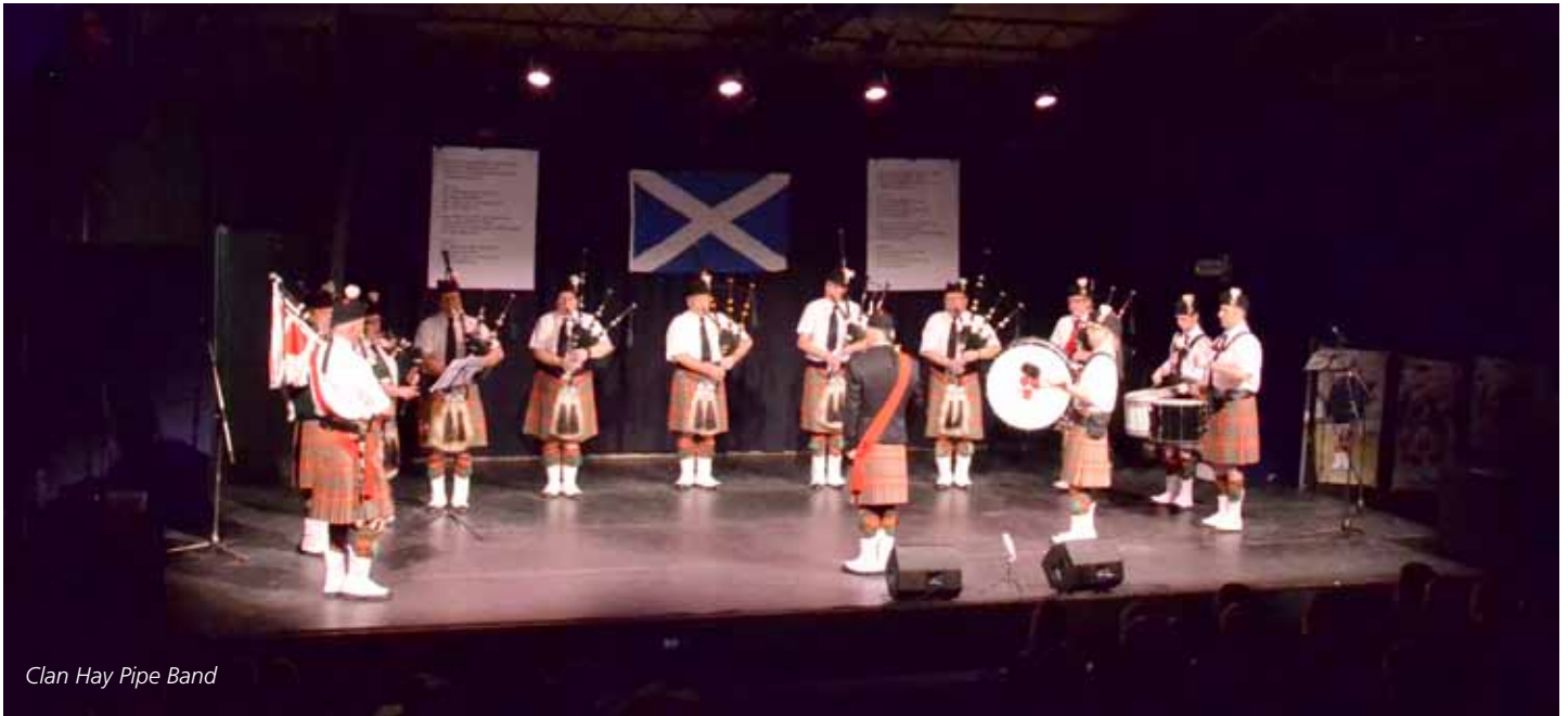
Clan Hay Pipe Band