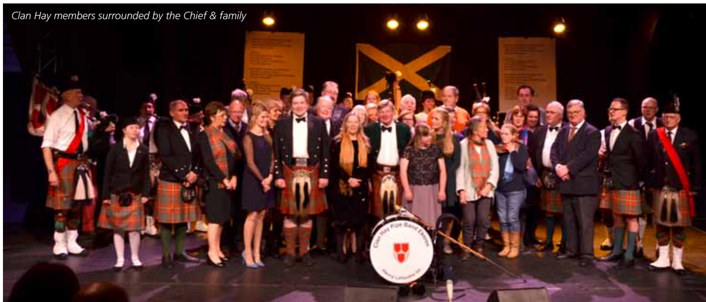
Clan Hay members surrounded by the Chief & family