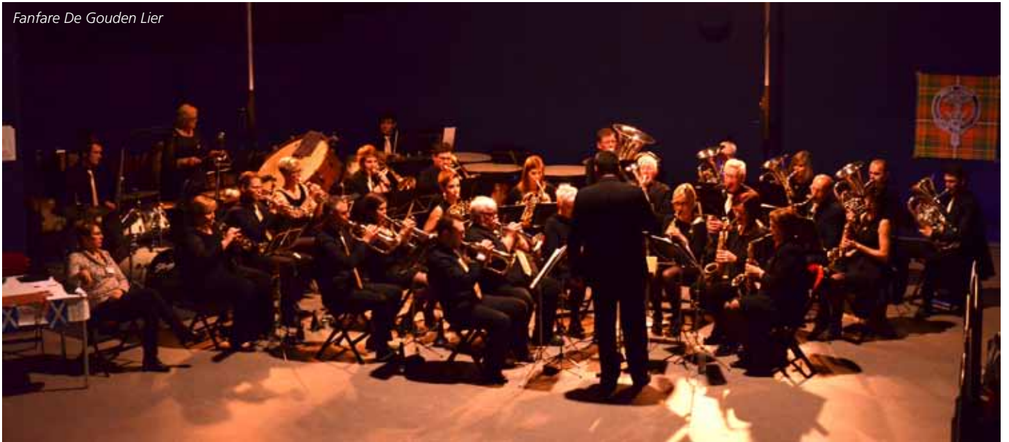
Fanfare De Gouden Lier